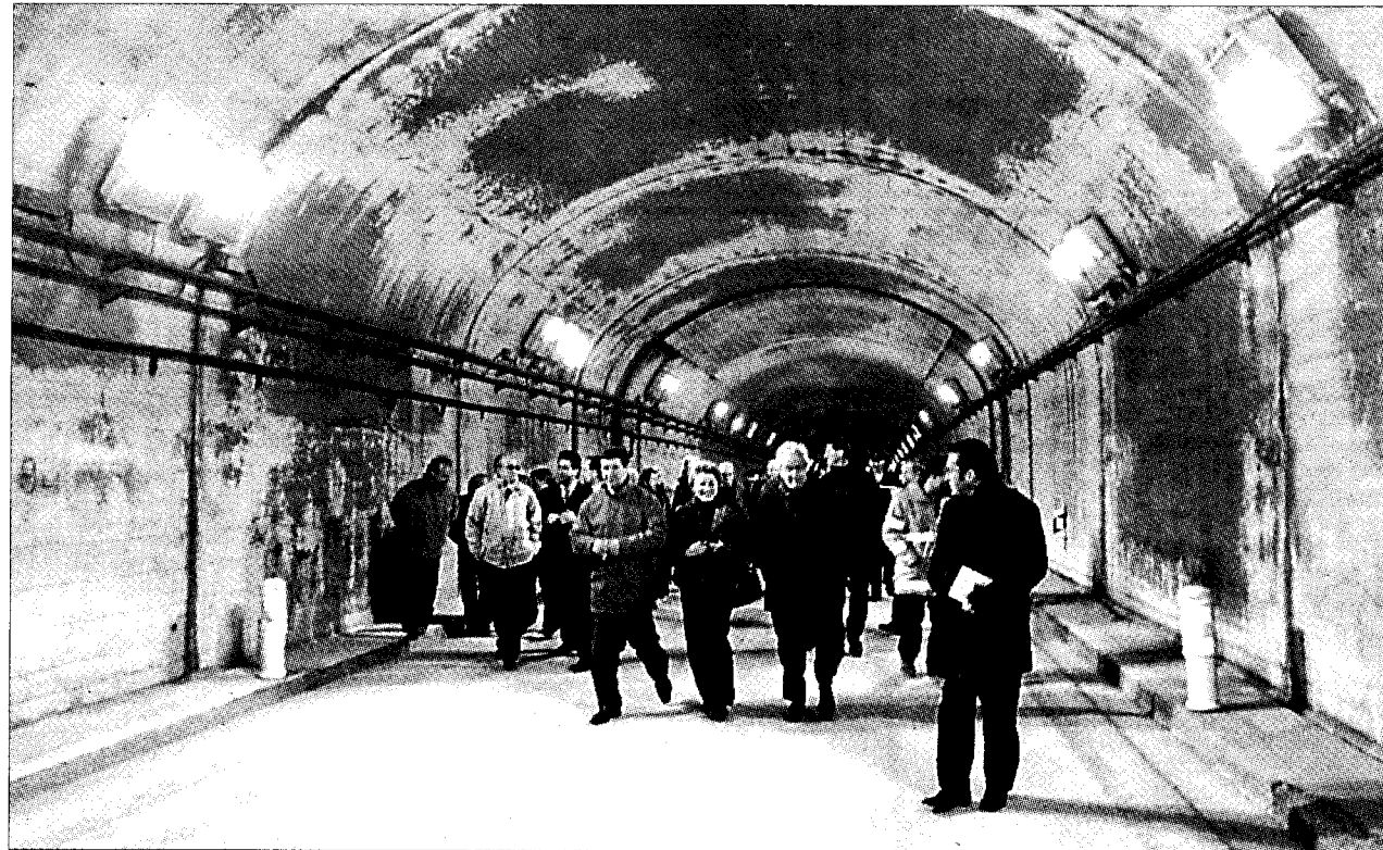
►► Las autoridades recorrieron el túnel ayer a mediodía.

Los cierres periódicos de este paso a instancias de las autoridades francesas y el establecimiento de franjas