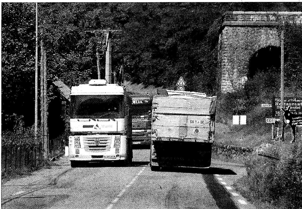
Varios camiones junto al túnel de Somport, en la parte francesa.

Desde este grupo de trabajo se ha solicitado al Gobierno francés el en-