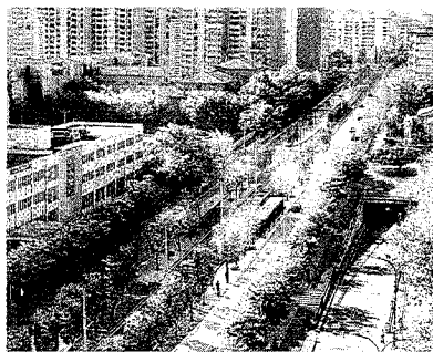
Recreación de Isabel la Católica. HERALDO