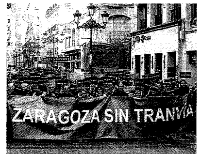
Manifestación de los contrarios al tranvía. J. M. MARCO