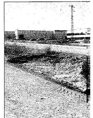
Empresas que se han quedado sin accesos