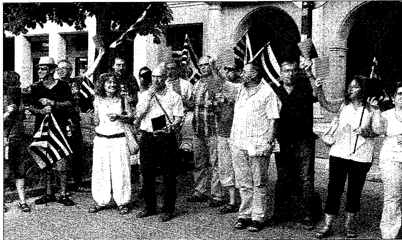
Los manifestantes de CHA muestran tarjeta roja durante el acto reivindicativo en la plaza Cervantes de Huesca.