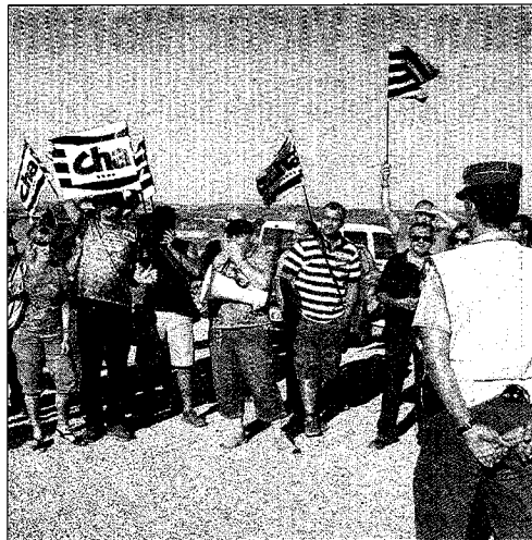
Miembros de CHA, IU y CCOO durante la protesta. PABLO SEGURA

En ambos tramos la velocidad de proyecto ha sido de 120 kilómetros/hora con dos calzadas de 7 metros de anchura cada una y arcenes exteriores de 2,50 metros, separados por una mediana de 10 metros. La inversión total en los tramos ha sido de 25.120.638,66 euros y en medidas medioambientales, 1.662.899,17 euros. La obra se ha completado con medidas de integración paisajística y restauración ambiental, señalización, balizamiento, defensas y cerramientos.