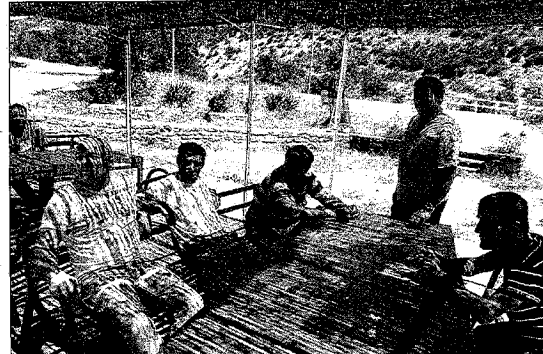
Unos obreros que trabajan en la A-23 en el descanso de la comida. P. SEGURA