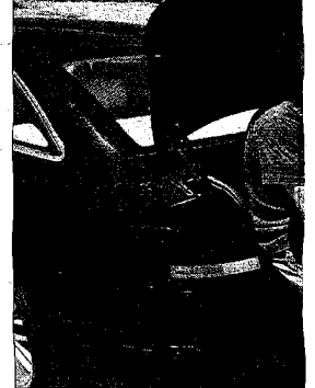
Turistas madrileños en Monrepós. P.S.

nes y señalan que en los túneles del Alto Monrepós ya se están ralentizando los trabajos.