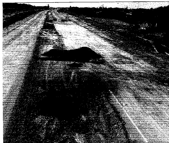
Aspecto que presentaba ayer la variante de Binéfar. J.L.P.

Cientos de personas que trabajan ahora en la autovía se