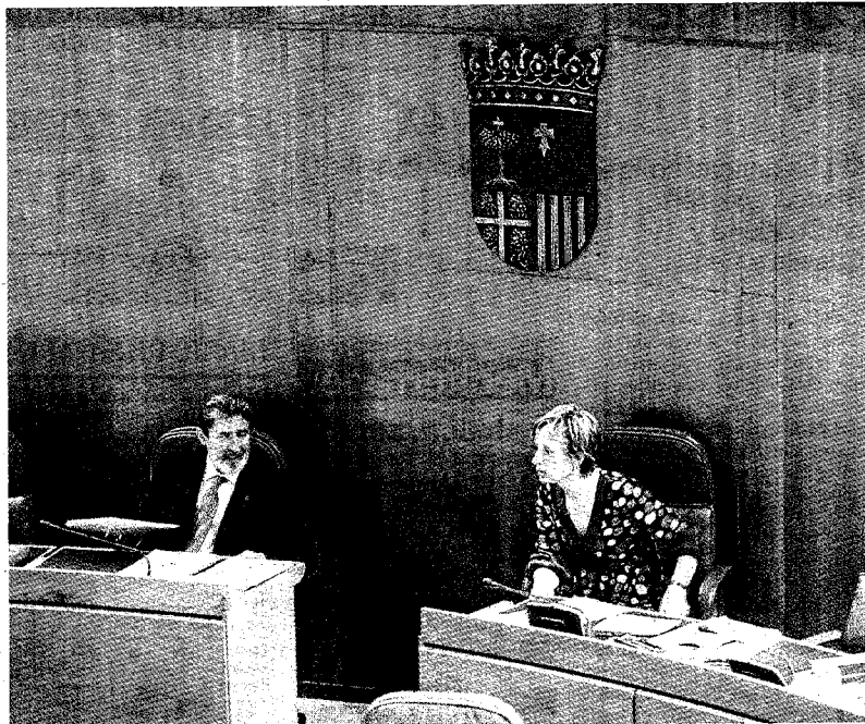
▶ CHA e IU unieron ayer sus fuerzas para instar la convocatoria de la diputación permanente.

Suárez calificó la comparecencia del titular de Fomento, José Blanco, en el Congreso como «absolutamente impresentable» puesto que «escamoteó información a los diputados, especialmente la referente al aumento del retraso que acumularán las