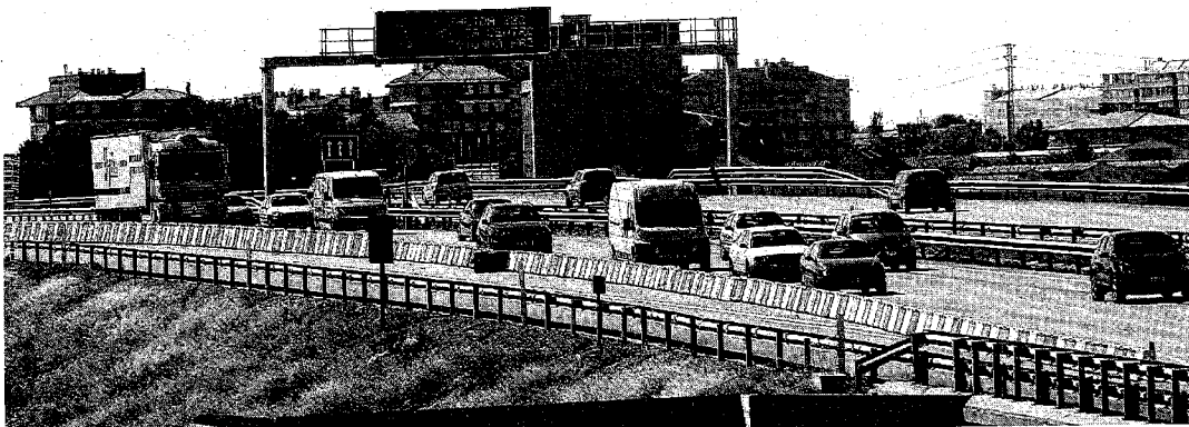
► La circulación en la Ronda Norte fue fluida a lo largo de la tarde, aunque más densa de lo habitual.