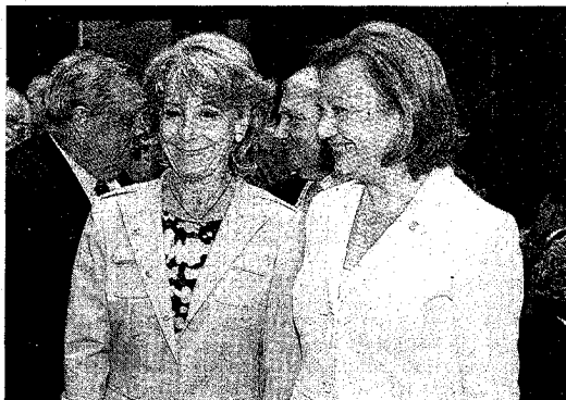
La presidenta de Madrid, Esperanza Aguirre, junto a Rudi, ayer.