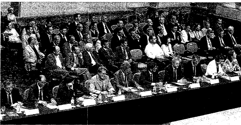
Al acto asistieron un centenar de personas de todos los ámbitos de la sociedad aragonesa. GUILLERMO MESTRE

Crónica | La Sala de la Corona del Pignatelli fue el lugar elegido para escenificar con la máxima solemnidad el consenso en torno a la TCP. Solo faltó Belloch