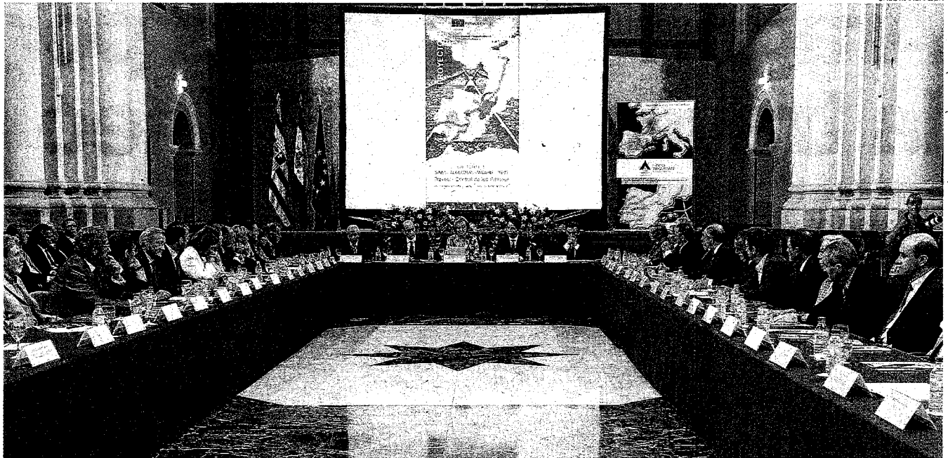
► Rudi y representantes del Ejecutivo, junto a los más de cuarenta representantes de colectivos sociales y económicos que firmaron el manifiesto.