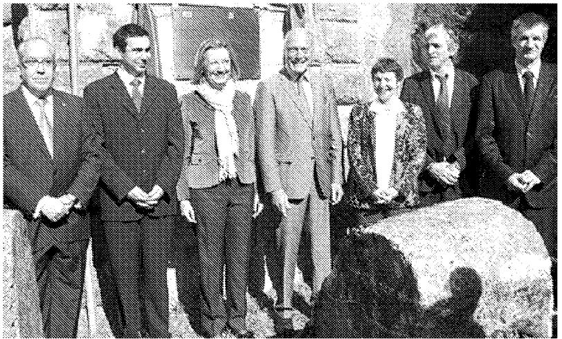
Dirigentes españoles y franceses, junto a la placa conmemorativa del aniversario. R.G.

>"La reivindicación sigue viva y ahora sí cabe con más fuerza que nunca", dice Rudi