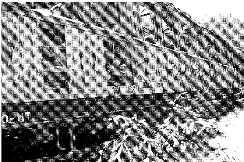
Vagones decrépitos en medio de la nieve Esta foto de Miguel Lame-las muestra los vagones abandonados en la playa de vías.

De coordinarlos se ha ocupado, desde Aveletra, Patricia Hueso. «La dificultad ha estado, más que en escribir sobre las imágenes, en la brevedad de los textos, ya que