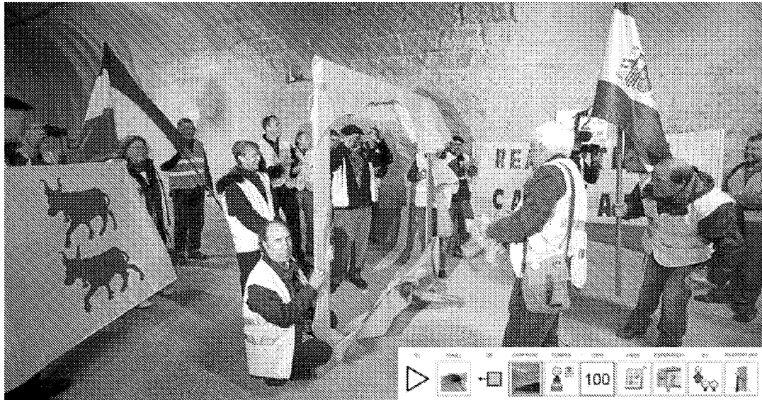
■ Autora de la frase con pictogramas: Raquel Rodrigo. Autor de los pictogramas: Sergio Palao. Procedencia: http://catedu.es/arasacc/ , con licencia de CC.

El pasado día 13, la presidenta de Aragón, Luisa Fernanda Rudi, y el presidente de Aquitania, Alain Rousset, ratificaron su compromiso en favor de la reapertura de la línea, durante la conmemoración del centenario de la perforación del túnel. Tras más de cuatro décadas de clamor de los aragoneses para reivindicar su reapertura y de compromisos incumplidos, el proyecto podría ver la luz en 2020, pero, de momento, sigue en vía muerta.