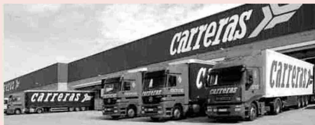
El Grupo Carreras es una de las muchas empresas logísticas en Plaza.

El Grupo Carreras se apoya en las ventajas de Plaza para incidir en su dimensión supranacional: "Estamos en pleno proceso de internacionalización, creando un 'hub' logístico en Zaragoza y una red de colaboradores en Europa para dar un servicio de paletaría complementario a los ser-