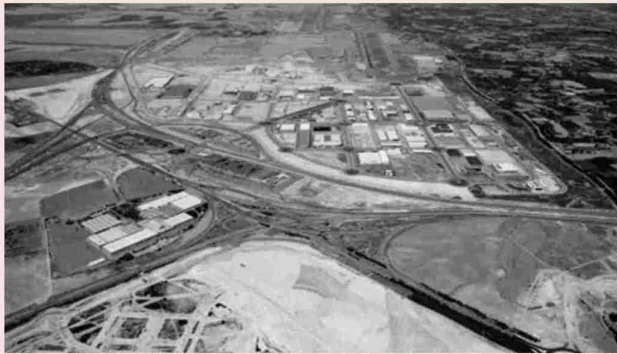
Vista aérea del recinto de Plaza, ubicado en el área suroccidental de Zaragoza.

Plaza es hoy una plataforma logística con una superficie que supera las 1.300 hectáreas de suelo bruto y que