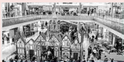
El centro comercial se ubica en plena Plataforma.