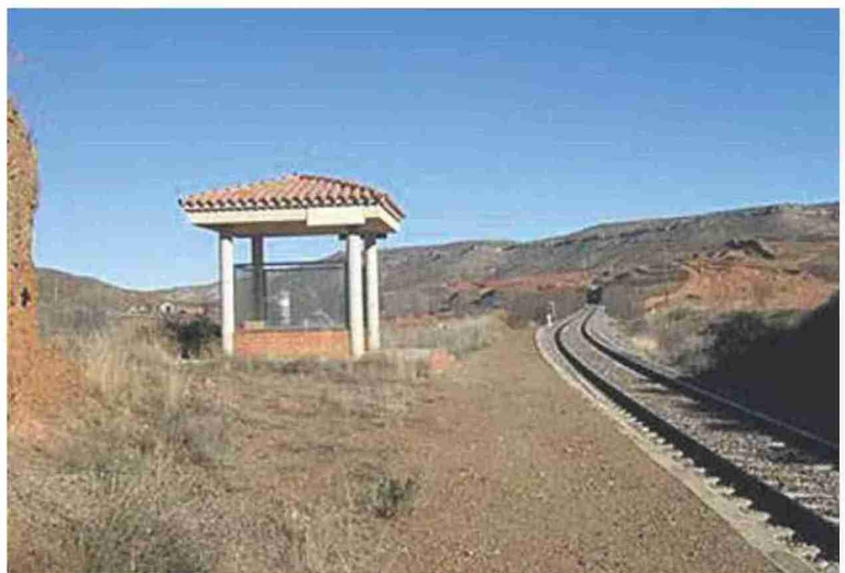
La pedanía de Calamocha, Lechago, cuenta con un apeadero de la línea ferroviaria Zaragoza-Teruel-Valencia