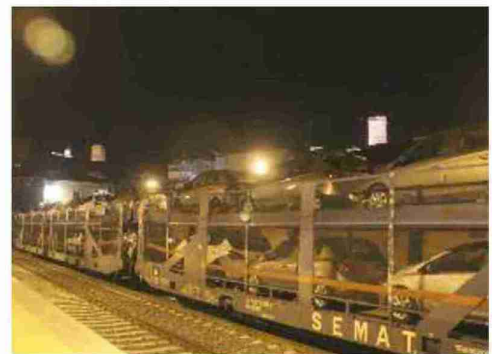
Convoy con vehículos de la GM a su paso por la estación de Teruel

Esta actuación la reclaman los agentes sociales, tanto en el documento elaborado por empresarios y sindicatos, como en la declaración suscrita hace poco más de un mes por las organizaciones empresariales de Aragón y Valencia.