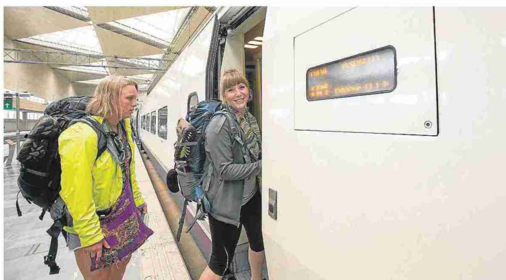
Imagen de archivo del AVE Zaragoza-Marsella cuando se inauguró la parada el 6 de julio de 2014.

Esta fue la respuesta de los aragoneses a la oferta que vino a presentar el embajador francés Jerome Bonnafont en su visita a Zaragoza el pasado mes de mayo. Bonnafont resaltó que unos 10.000 aragoneses utilizaron la nueva línea del AVE que comunica con Francia desde que se puso en marcha la conexión Zaragoza-Marsella en julio de 2014. Pero el embajador destacó que los turistas de Aragón tienen un gran potencial porque Francia recibe a unos 200.000 aragone-