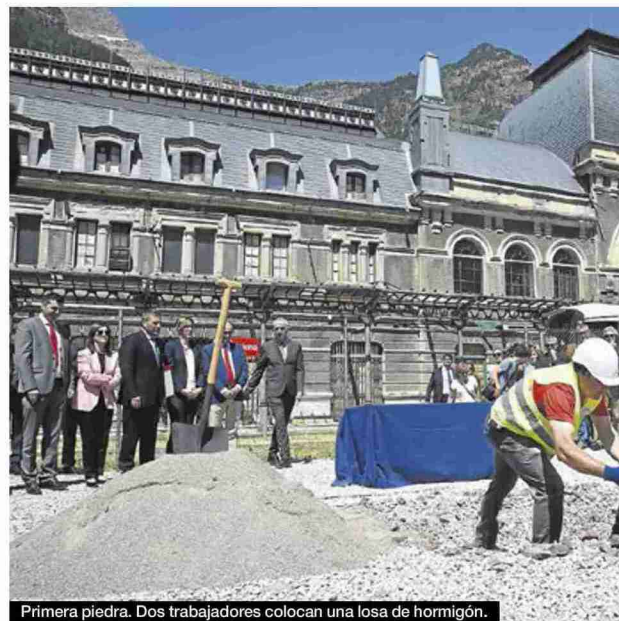
Primera piedra. Dos trabajadores colocan una losa de hormigón.