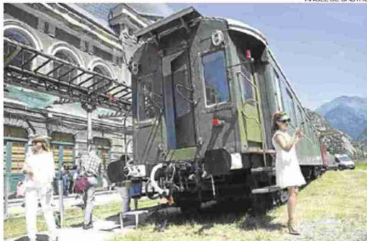
► Nueva zona ► La actuación empezará detrás del edificio principal.

«Dentro de tres o cuatro años se notará la transformación», dice el alcalde